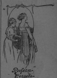
Pradilla y Cia, Agentes para So. la His.

Use Corset Warner Lavables Señora: Inoxidables