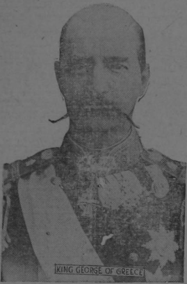
KING GEORGE OF GREECE

El Rey Jorge de Grecia, que fué asesinado en las calles de Salónica.