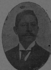
GENERAL MANUEL BONILLA

Por el mismo motivo suspendió nuestra Banda Militar el concierto del domingo.